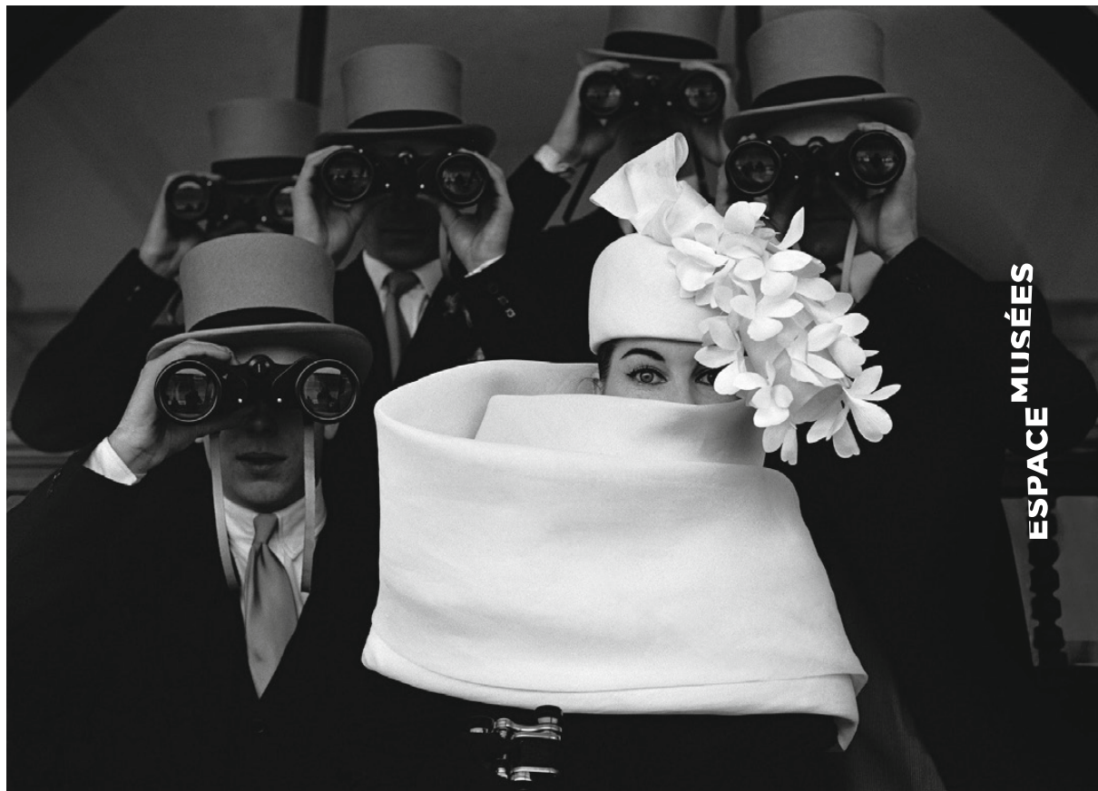
Frank Horvat, Chapeau Givenchy, Paris, 1958