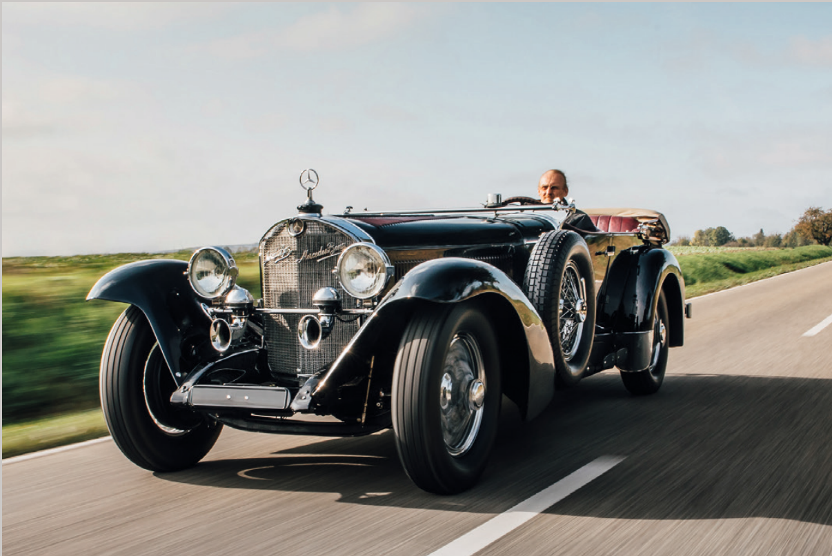
1929 Mercedes-Benz 710 SS Sport Tourer par Fernandez & Darrin